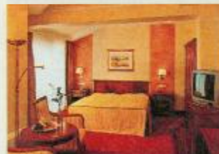
Warme Farben bestimmen die Ausstattung der geräumigen Zimmer

training wie Walken, Nordic Walking, Radfahren oder Joggen, außerdem Wassergymnastik und Body-Styling, Sportmassagen mit Tiroler Steinöl, Kraft-Ausdauertraining sowie ein individuell aus-