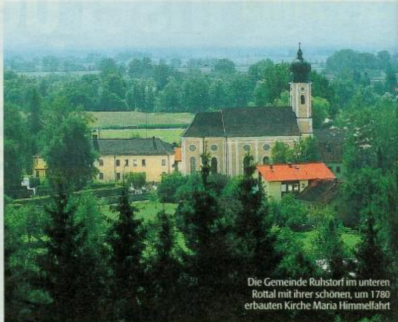
Die Gemeinde Ruhstorf im unteren Rottal mit ihrer schönen, um 1780 erbauten Kirche Maria Himmelfahrt