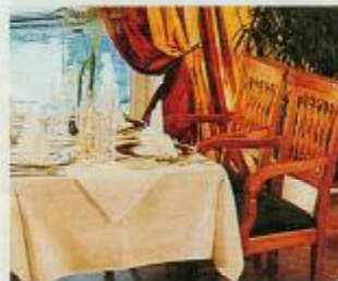
Gediegene Eleganz: Im Hotelrestaurant ist stets festlich gedeckt

Das Vier-Sterne-Wellness-Hotel Antoniusshof in Ruhstorf, in dem die Gewinner unseres Preisausschreibens eine Fitness-Woche verbringen, erfüllt höchste Ansprüche. Zum Gewinn gehören fünf Übernachtungen mit der „Antonius-Viel-Inclusive-Pension“. Dazu zählen neben einem reichhaltigen Frühstücksbuffet (bis 11 Uhr!) wahlweise Trennkost-Diät-Vollpension oder Vier-Gang-Halbpension. Auch wer letztere wählt, kann sich mittags an einem Salatbuffet stärken und nachmittags Kaffee und Kuchen genießen. Die Fitness-Woche beginnt mit einer Ernährungsberatung und einem Check-Up. Später erwartet die Gewinner Ausdauer-